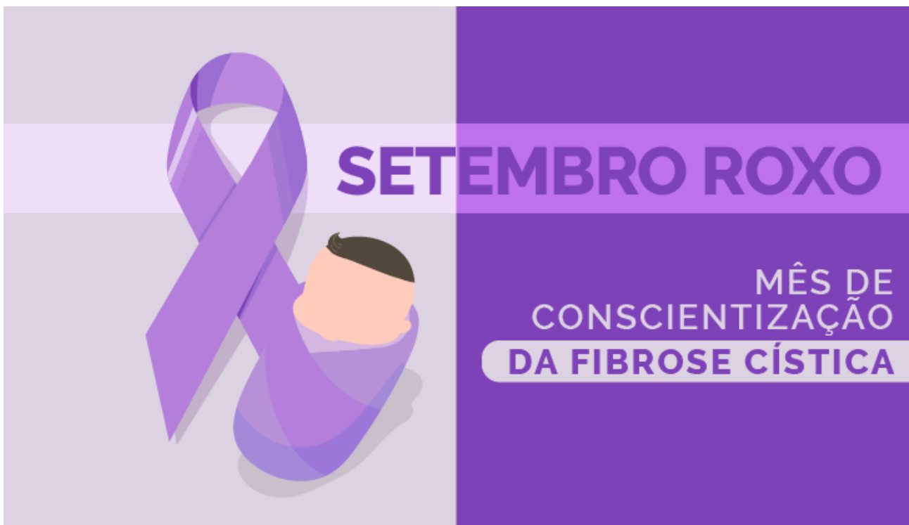
Imagem: Reprodução Secretaria de Saúde do DF/EDIÇÃO: JOHNNY BRAGA